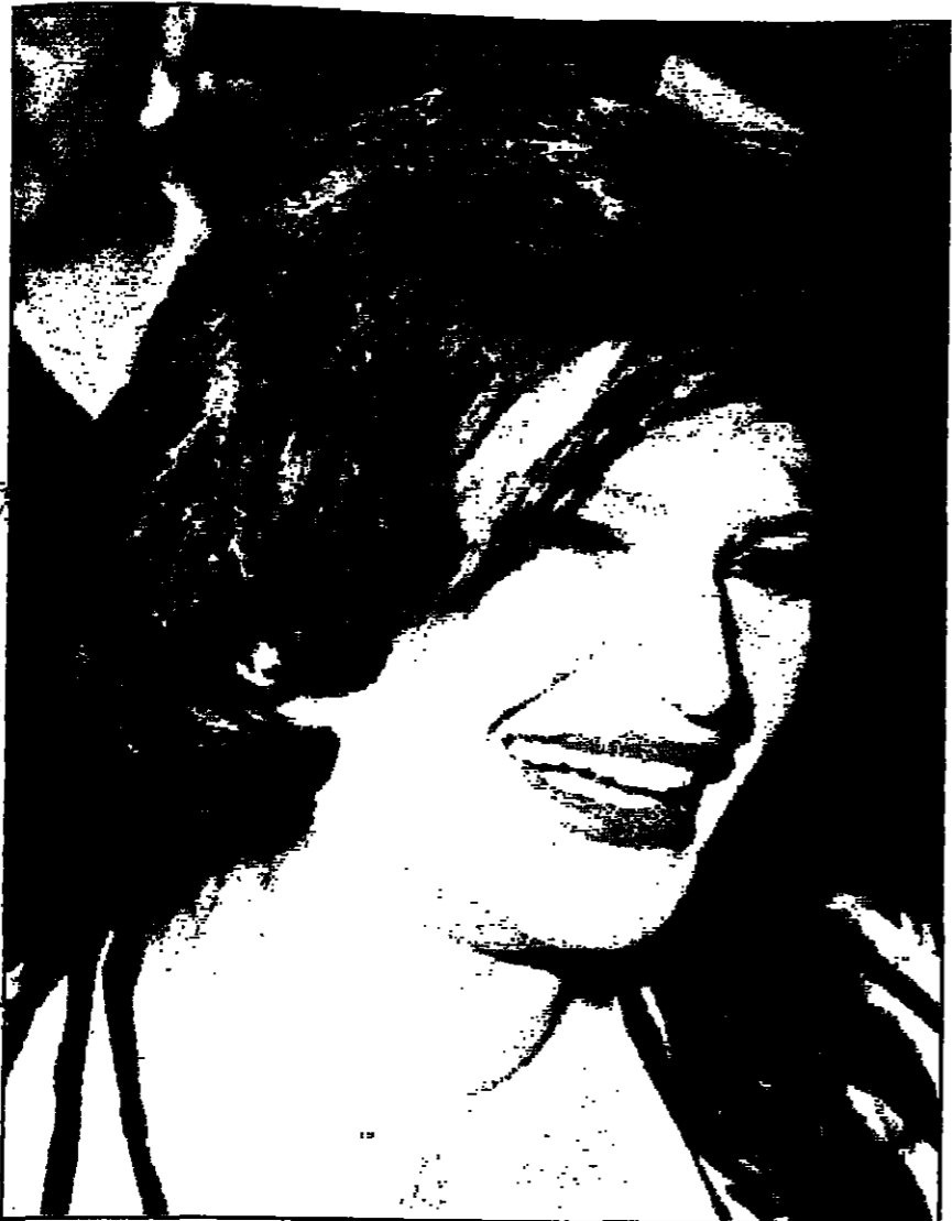
نجوى فؤاد